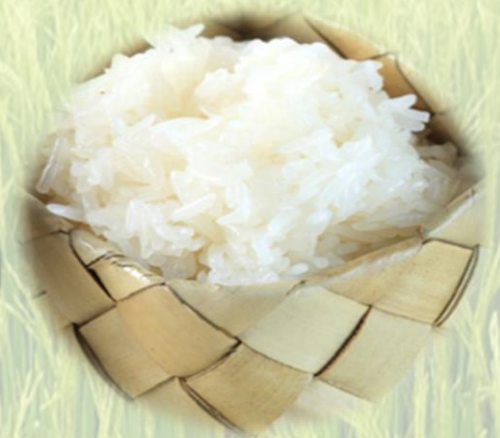
ข้าวเหนียว