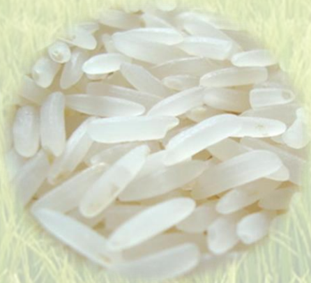
ข้าวหอมมะลิ