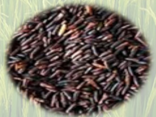
ข้าวเพื่อสุขภาพ